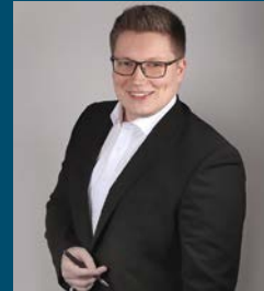
Markus Rückert Entwicklung & Umsetzung